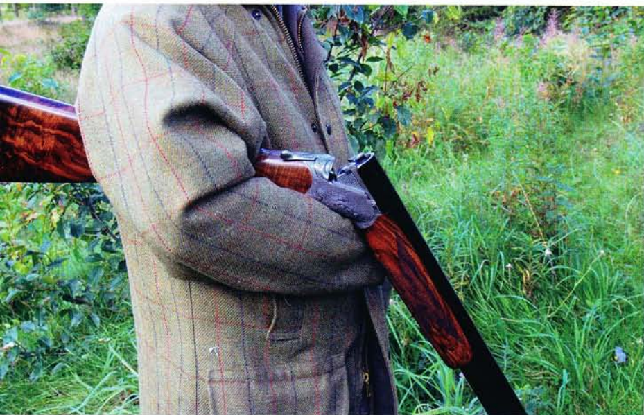
Guerinis Ellipse er helt igennem elegant med round body og udsøgt skæftetræ. Det er pænt både på skæftet og gennemført helt ud til spidsen af forskæftet. Samlingerne mellem metal og træ er upåklagelige.

► kisk valnød, og med en gennemført olieret og højglanspoleret overflade. Der er sandsynligvis brugt en del håndarbejdstimer på disse skæfter, for en maskinpolering kan ikke levere en sådan overflade.