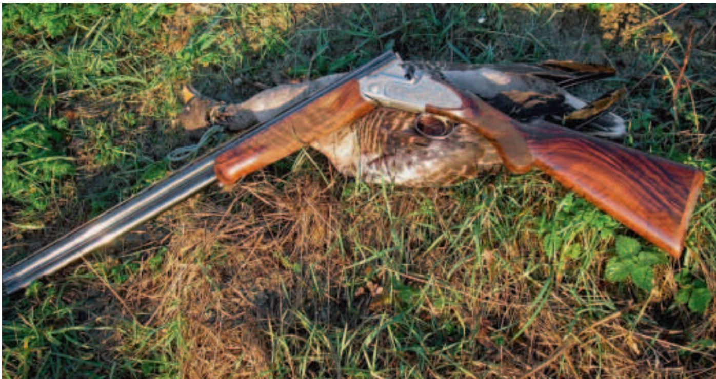
Det smukke skæftetræ afstedkom - berettiget - mange rosende bemærkninger på efterårets jagter. Kolbekappen er også udført i valnøddetræ.