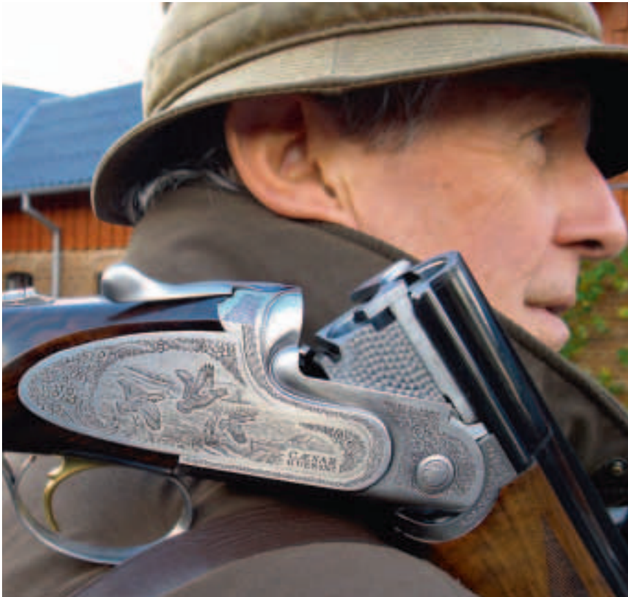
De nydelige graveringer af jagtmotiver, slyngninger og blomster er udført på maskine, men de ser ganske autentiske ud.